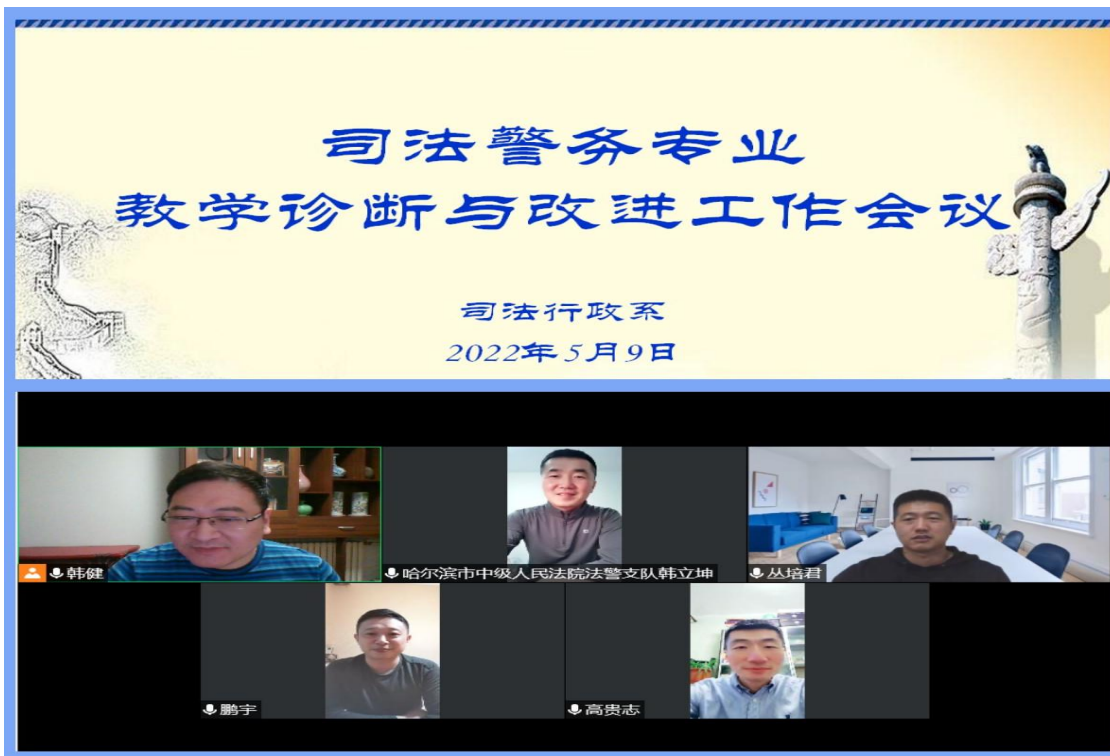
（图片 1：行业专家在线研讨司法警务专业人才培养方案）

求，就司法警务专业人才培养模式构建、课程体系的搭建、核心课程团队建设、院警共建课程开发、专兼职教师交流机制、课内实训安排、理论与应用交流等方面进行了广泛深入的探讨。